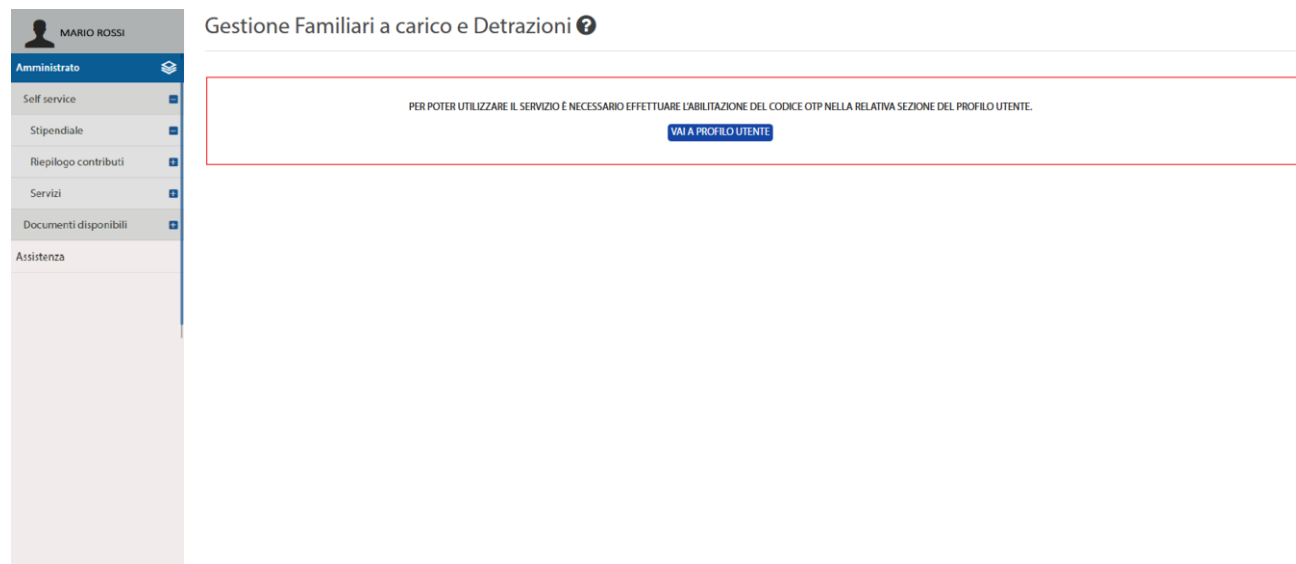
Figura 2 - Pagina iniziale del self service Gestione familiari a carico e Detrazioni (schermata visualizzata in caso di accesso all'area privata tramite SPID ed OTP non ancora abilitato)

Cliccando su Gestione familiari a carico e Detrazioni si arriva alla pagina del servizio mostrata in Figura 2: